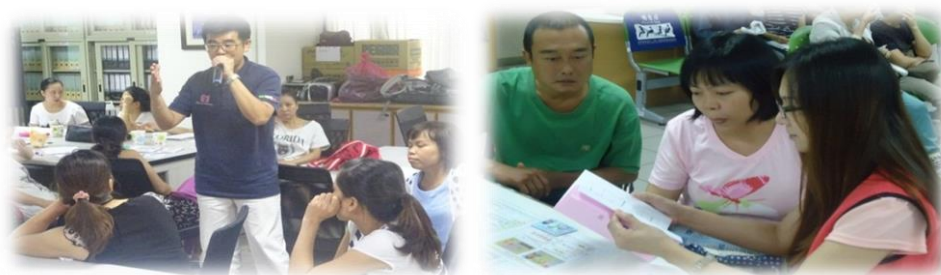
圖 4 新住民會客輔導及上課情形