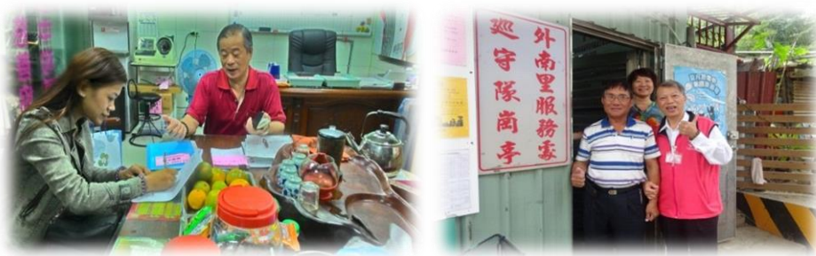
圖 1 本所同仁至里長服務處宣導戶政業務工作剪影