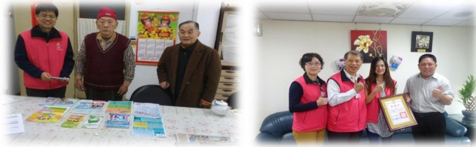
圖 2 本所同仁至社區辦理戶籍業務 圖 3 榮民服務處派員感謝本所臨櫃成功防堵詐騙